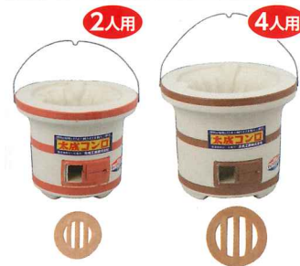
No.6109 木炭コンロ 小型(ツル付・プレス鉄帯巻) Φ260×H225mm No.6113 木炭コンロ 大型(ツル付・プレス鉄帯巻) Φ295×H255mm