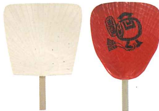
No.7661 和紙 白うちわ No.7662 渋うちわ百万両 赤