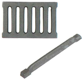
No.7227 棒ロストル240 L240mm No.7228 棒ロストル300 L300mm No.7224 角ロストル 160×105mm