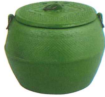
No.7345 頭なし φ290×H267×口径220mm No.7344 特大 φ250×H217×口径178mm No.7343 大大 φ242×H204×口径174mm No.7342 大 φ230×H191×口径162mm