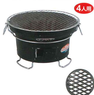
No.6107 BQ「能登」丸型特製 環玉付黒色 Φ265×H165mm