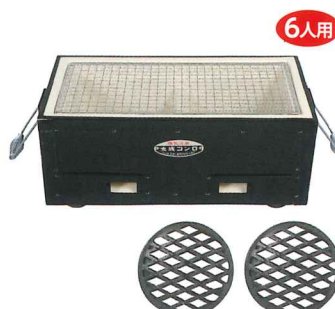
No.6101 BQ「能登」大 鉄板巻き W390×D220×H170mm