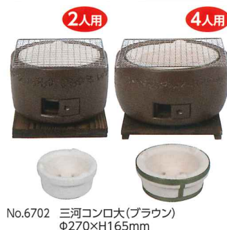
No.6702 三河コンロ大(ブラウン) Φ270×H165mm No.6701 三河コンロ(茶) Φ220×H165mm