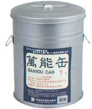
No.7313 9号 φ275×H340mm No.7312 8号 φ240×H310mm No.7311 7号 φ210×H260mm