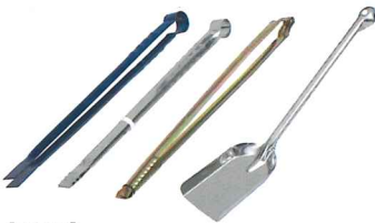
【火挟み】 No.7131 ステン火バサミ 23cm No.7132 ステン火バサミ 30cm No.7133 ステン火バサミ 45cm No.7134 ステン火バサミ 65cm No.7135 折り鉄火バサミ 45cm特厚 No.7136 さざ波ユニ 45cm 【十能】 No.7425 石炭十能 (ステン)