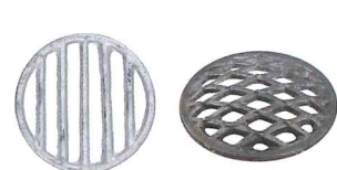
No.7161 平型3.5寸 Φ105mm No.7162 平型4.0寸 Φ120mm No.7163 平型4.5寸 Φ135mm No.7164 平型5.0寸 Φ150mm No.7165 平型5.5寸 Φ165mm No.7166 平型6.0寸 Φ180mm No.7167 平型6.5寸 Φ195mm No.7168 平型7.0寸 Φ210mm No.7223 BQ用ドーム Φ120mm