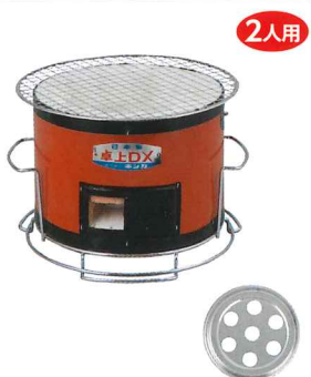
No.6401 卓上コンロDX Φ205×H170mm