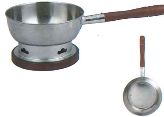
No.7411 台十能 (ステン・木製台・柄付) φ195×H120×L400mm