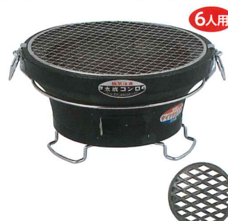
No.6121 BQ「能登」丸型特製 環付黒色 大 Φ305×H160mm