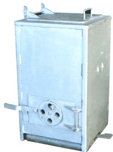
No.6750 耐熱火起しコンロ18型 スチール製 350×350×H600mm