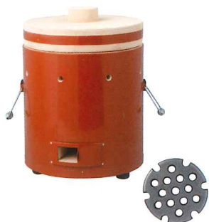
No.6133 切出し火種コンロ 7号 Φ320×H445mm