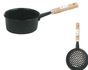
No.7353 火起し(スチール焼付塗装) Φ150×H60×L300mm