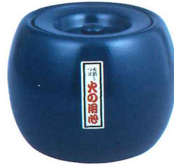
No.7302 中 φ220×H185mm No.7301 小 φ210×H170mm