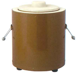
No.7310 切出し火消しつぼ 7号 φ320×H410mm