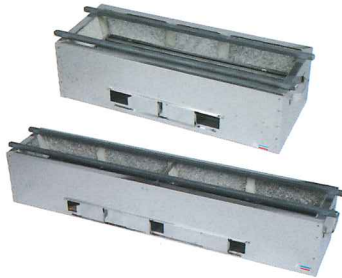
No.6915 SC-900 900×180×H160mm No.6914 SC-750 750×180×H160mm No.6916 SC-624 600×240×H160mm