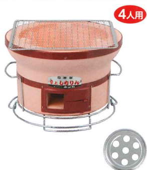
No.6402 卓上しちりん Φ255×H185mm