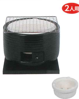
No.6700 三河コンロ(ブラック) Φ210×H155mm