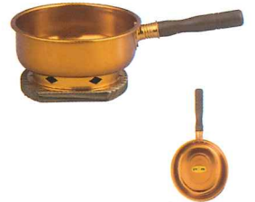
No.7410 台十能 (アルミ小判型・木製台・柄付) φ160×180×H100×L320mm