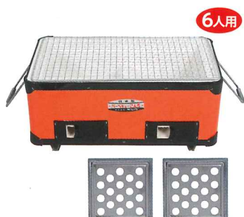
No.6410 バーベキューコンロ(角型) W375×D215×H175mm