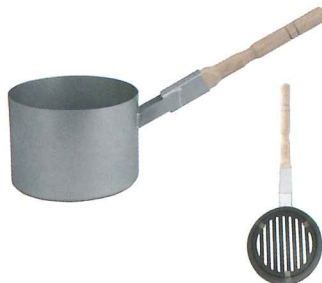
No.7352 火起器(スチールアルミメッキ) Φ200×H140×L500mm