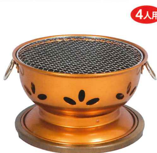
No.6801 割烹 炭火亭 Φ260×H145mm