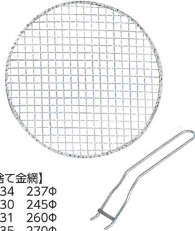
【使い捨て金網】 No.7234 237φ No.7230 245φ No.7231 260φ No.7235 270φ No.7232 280φ No.7240 280ドーム No.7254 網グリッパー