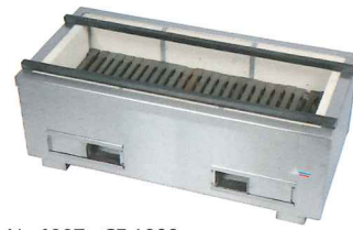
No.6907 CF-1200 1200×360×H270mm No.6902 CF-900 900×360×H270mm No.6901 CF-750 750×360×H270mm No.6900 CF-600 600×360×H270mm