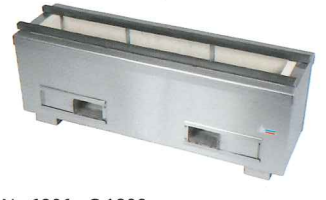
No.6906 C-1200 1200×220×H270mm No.6905 C-900 900×210×H270mm No.6904 C-750 750×210×H270mm No.6903 C-600 600×220×H270mm