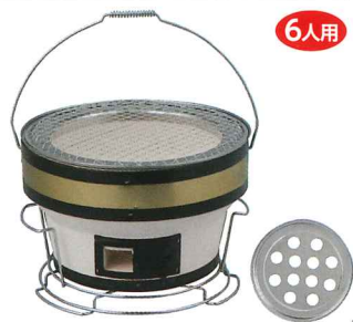
No.6421 焼肉しちりん台付 Φ290×H195mm